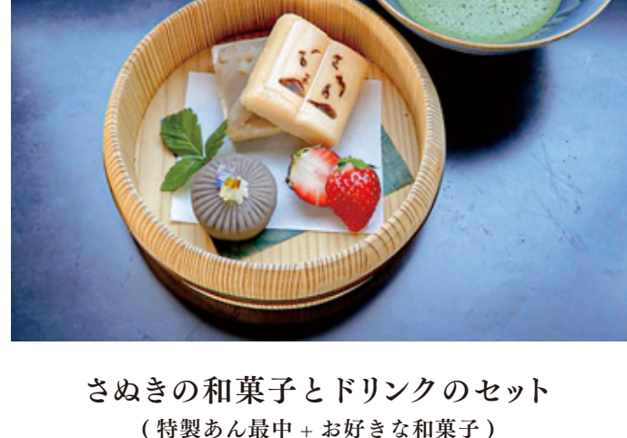
さぬきの和菓子とドリンクのセット (特製あん最中+好きな和菓子)