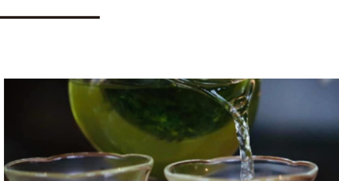
高瀬茶(緑茶/紅茶<ベニ茶>)