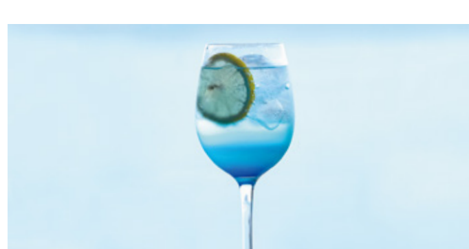
ブルーレモンソーダ