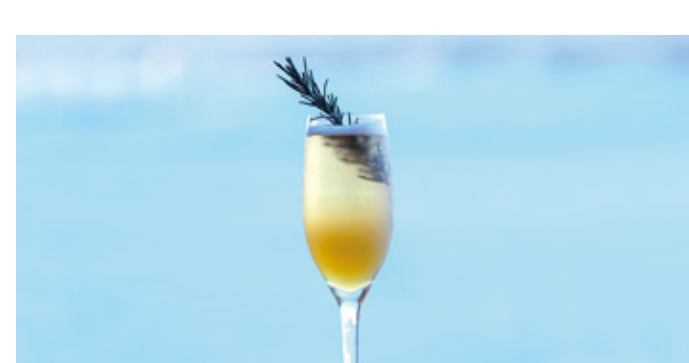
緑茶スパークリング