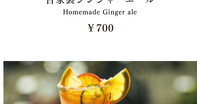
旬のフルーツのシトラスジンジャー