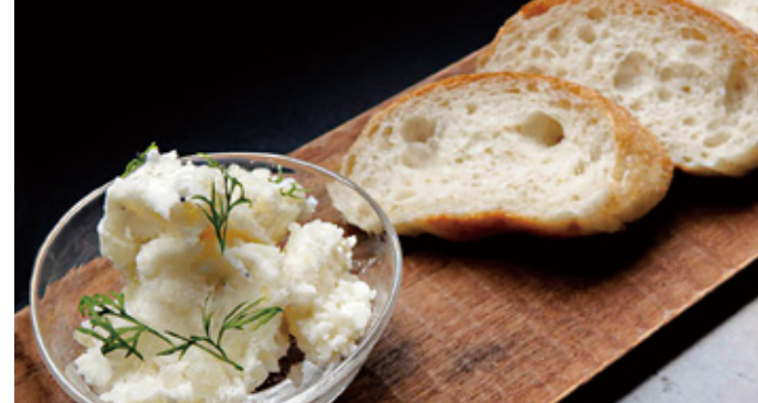
瀬戸内産しらすのポテトサラダ

(ari panさんのフォカッチャ付き) Setouchi whitebait potato salad with focaccia