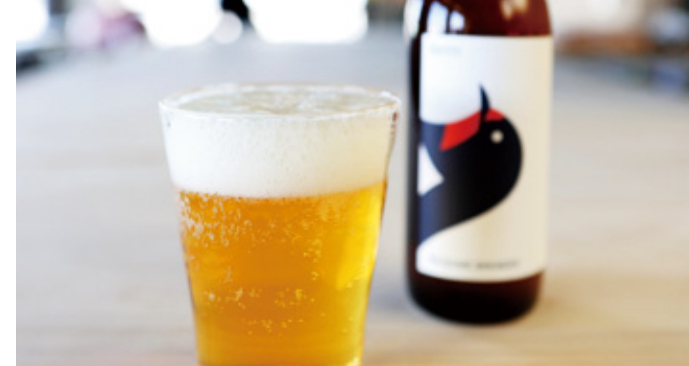
ツバメブリュワリー ビール