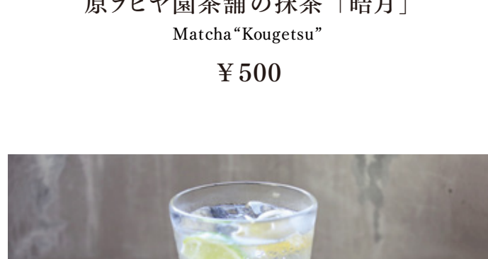
自家製ジンジャーエール