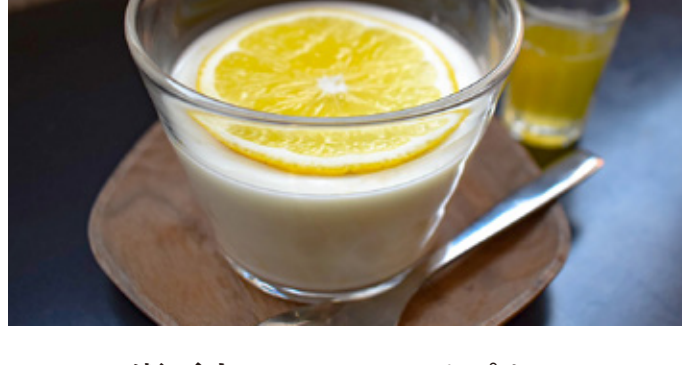
瀬戸内レモンミルクプリン