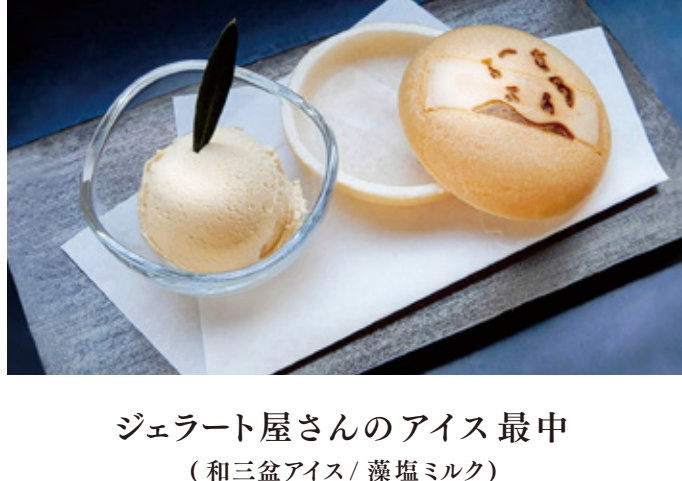
ジェラート屋さんのアイス最中 (和三盆アイス/産塩ミルク)