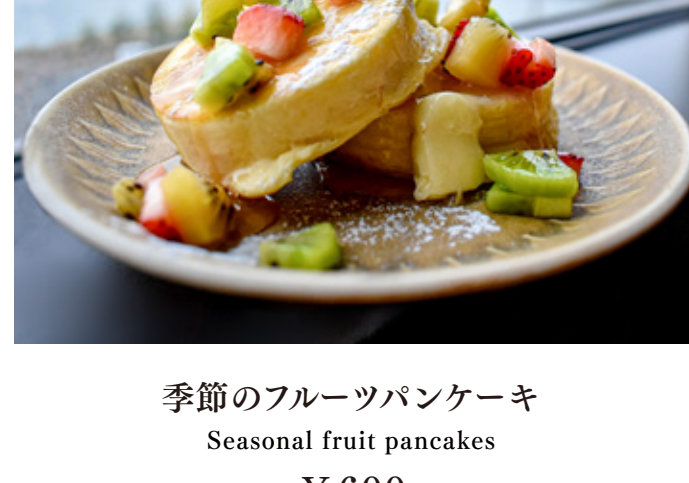
季節のフルーツパンケーキ