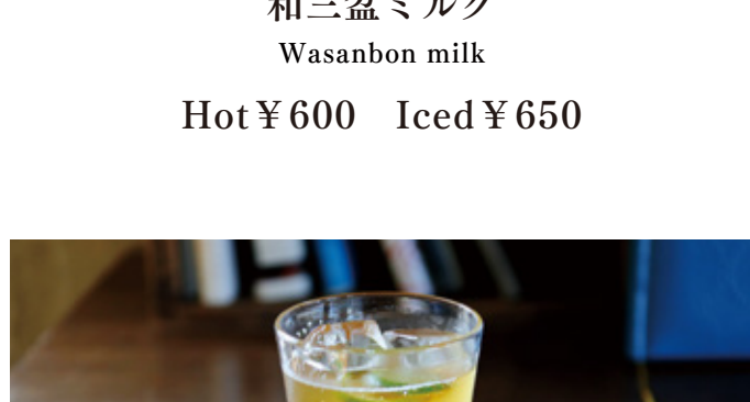
瀬戸内 Tea ソーダ