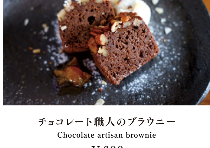
チョコレート職人のブラウニー