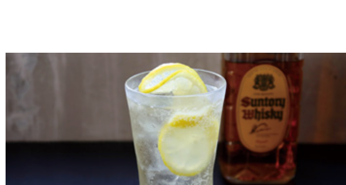
瀬戸内ハイボール