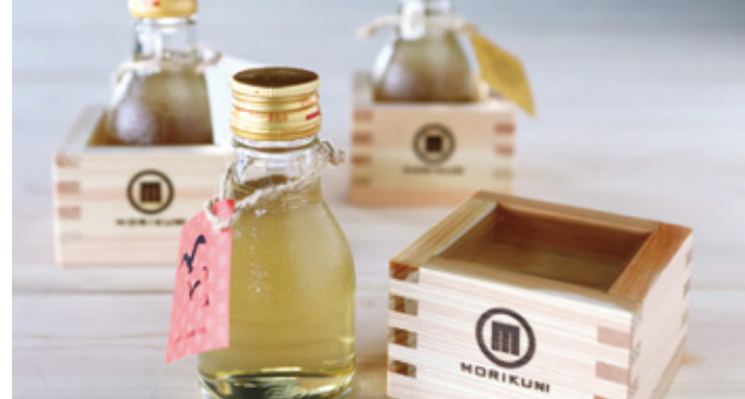
森国酒造の日本酒 一合