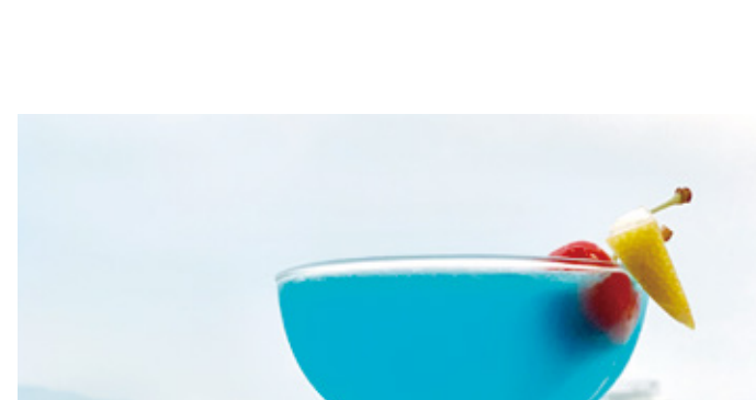
ブルーレモンサワー