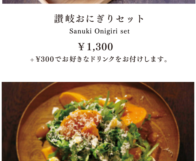
讃岐おにぎりセット Sanuki Onigiri set