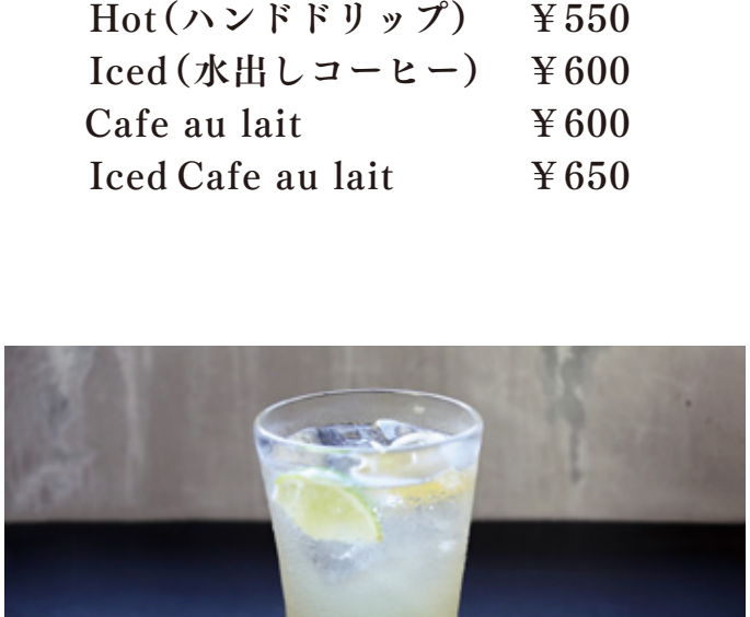
新茶のモヒート Fresh green tea mojito