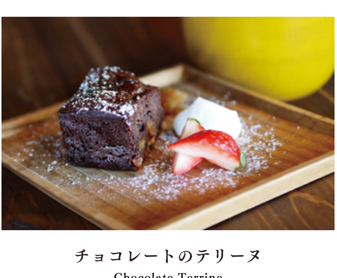
季節のフルーツパンケーキ Seasonal fruit Pancake