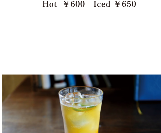
旬のフルーツのシトラスジンジャー Citrus ginger