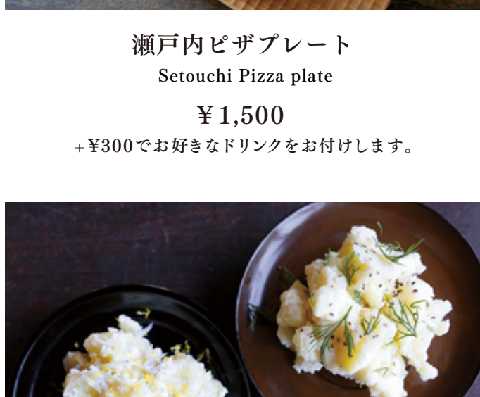
瀬戸内ピザプレート Setouchi Pizza plate