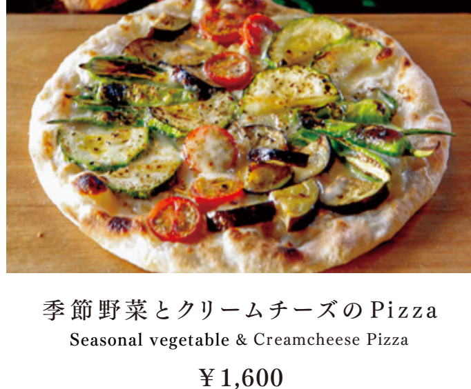
季節野菜とクリームチーズの Pizza Seasonal vegetable & Creamcheese Pizza