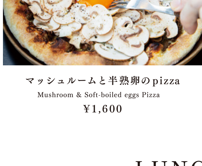
マッシュルームと半熟卵の pizza Mushroom & Soft-boiled eggs Pizza