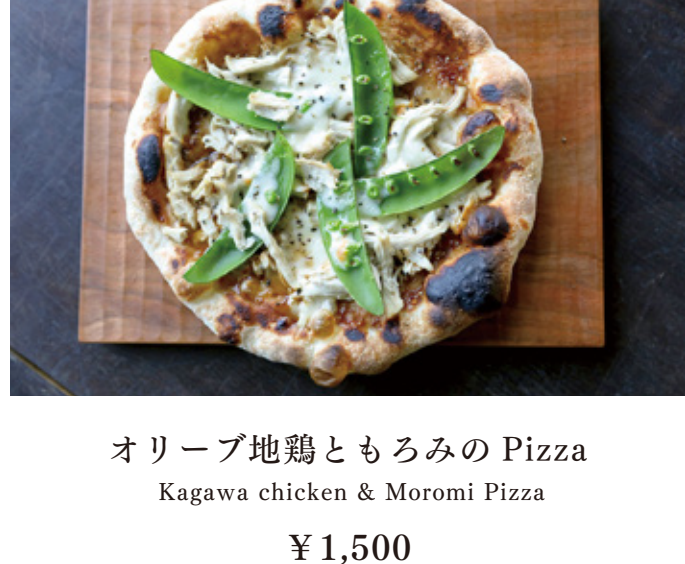
オリブ地鶏ともろみの Pizza Kagawa chicken & Moromi Pizza