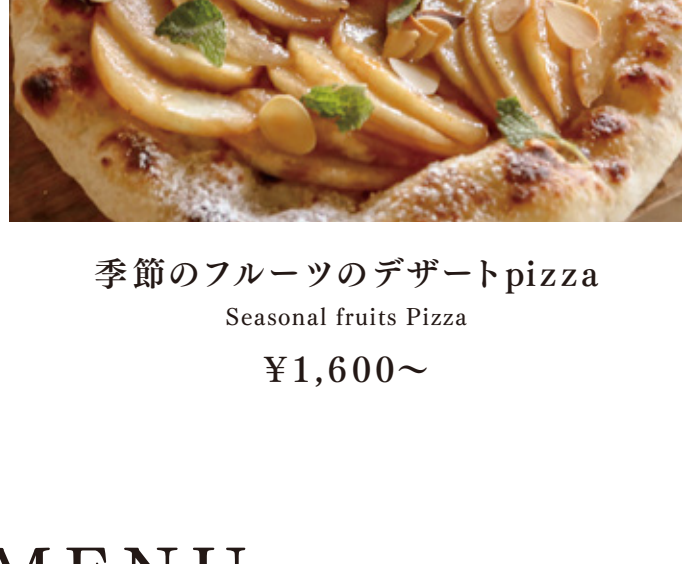
季節のフルーツのデザートpizza Seasonal fruits Pizza